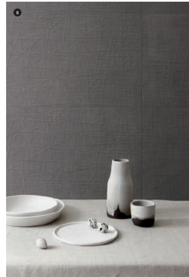
7 MQUR Fabric Wool 40x120 MPDH Mosaico Hemp 40x40